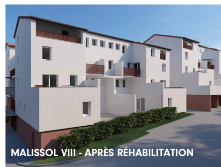
MALISSOL VIII - APRÈS RÉHABILITATION

Dans la continuité des efforts fournis pour améliorer le quotidien et le confort des locataires, deux nouvelles réhabilitations viennent de débuter à Vienne.