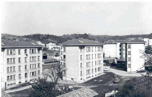
Cité Jardin - 1951

Nous souhaitons à notre office Advivo un très bon anniversaire, fort de la confiance et de l'espérance que nous portons, en sa capacité de poursuivre très longtemps encore sa mission de service public.