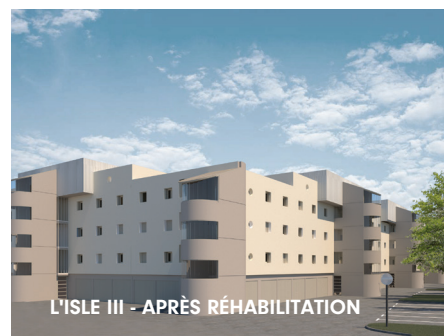
L'ISLE III - APRÈS RÉHABILITATION