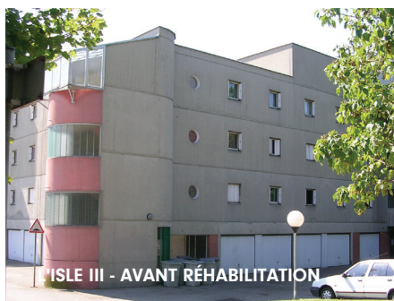
L'ISLE III - AVANT RÉHABILITATION