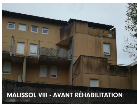
MALISSOL VIII - AVANT RÉHABILITATION