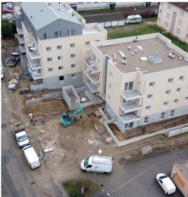
Résidence "Evidance" en construction à Pont-Évêque