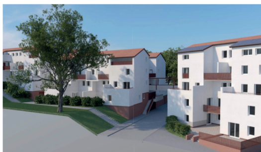
Résidence Malissol VIII après réhabilitation

La maintenance du parc englobe l'entretien courant des résidences, les travaux de gros entretien, la remise en état des logements vacants, l'aménagement des salles de bain pour les personnes âgées ou porteuses d'un handicap, les travaux de sécurisation des halls des allées, la réfection des parties communes, etc.