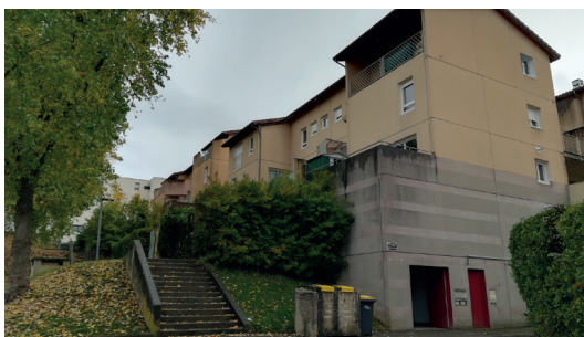
Résidence Malissol VIII avant réhabilitation

Avec notamment la poursuite des travaux de réhabilitations de 372 logements : Vimaine II (48 logements), l'Isle II et III (150 et 39 logements), Malissol VIII (41 logements), avec un axe important concernant le volet thermique afin de faire baisser les charges locatives.